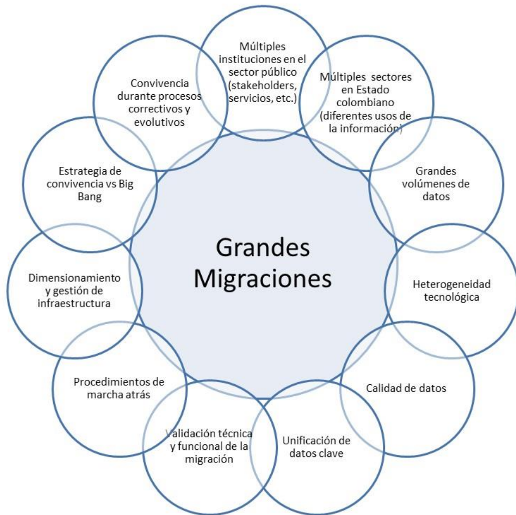
Ilustración 1. Factores claves de éxito en la Migración de Datos