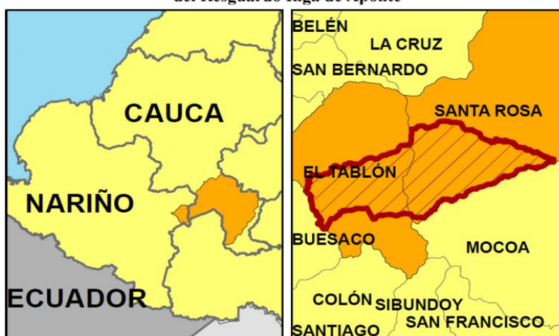
Imagen No. 11. Esquema de ubicación general departamental y municipal del Resguardo Inga de Aponte