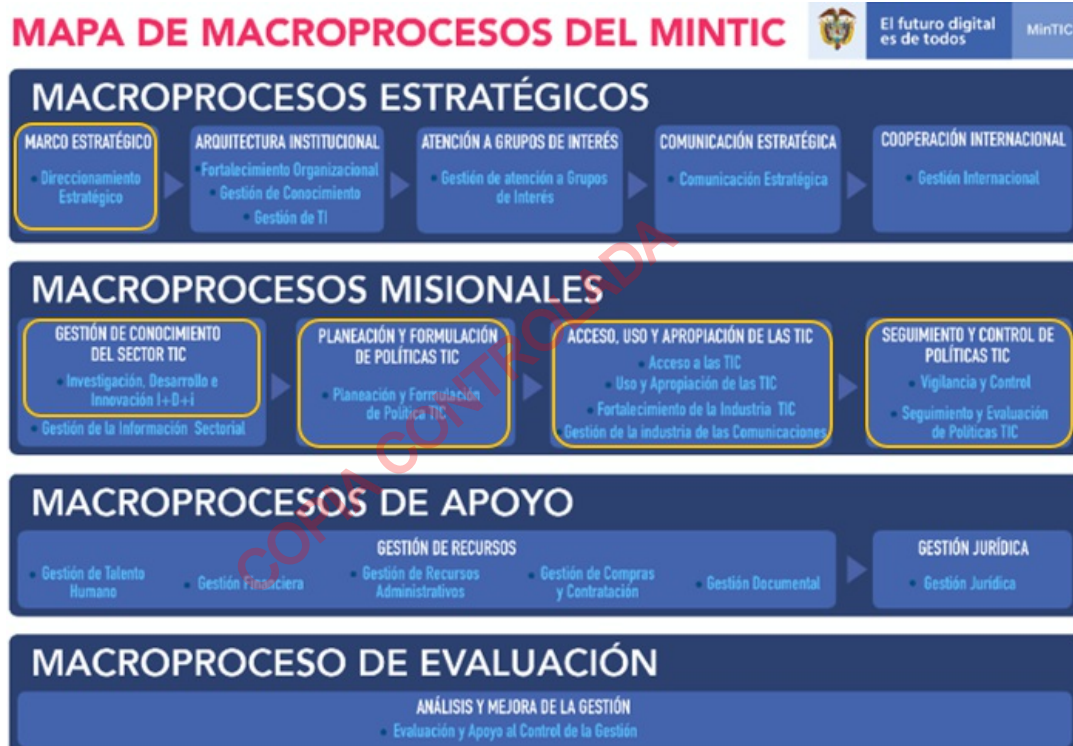
Figura 1. Mapa de macroprocesos MIG – macroprocesos que intervienen en el Ciclo de Políticas Públicas TIC.

En el MinTIC, el Mapa de Macroprocesos del Modelo Integrado de Gestión (MIG) cuenta con el desarrollo del Ciclo de políticas públicas a través de los procesos misionales que se encuentran articulados con los objetivos y funciones de la Entidad establecidos en el Decreto de Estructura del Sector TIC.