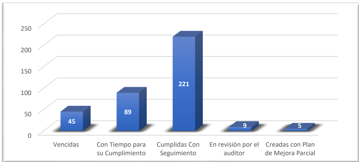
Gráfico 2. Estado acciones de mejora abiertas registradas en SIMIG.

De igual manera, se relaciona de forma general el estado de las 369 acciones de mejora abiertas tanto de planes de mejoramiento internos como de CGR: