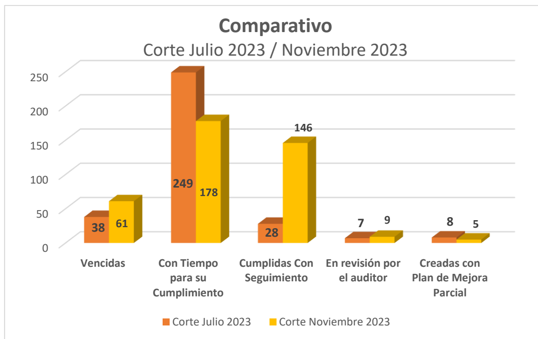
Ilustración 3. Comparativo estado acciones de mejora abiertas registradas en SIMIG respecto al corte anterior

En la siguiente gráfica se presenta un comparativo del estado de las acciones abiertas con relación a los datos presentados en el informe anterior (31 de julio de 2023).