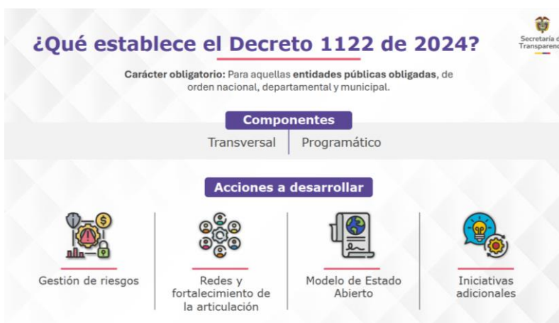
Imagen 1. Componentes y acciones del Programa de Transparencia y Ética Pública.

Finalmente, las entidades del orden nacional deben dar cumplimiento a los siguientes requisitos mínimos del régimen de transición, como lo establece la circular CIR25-00000026: